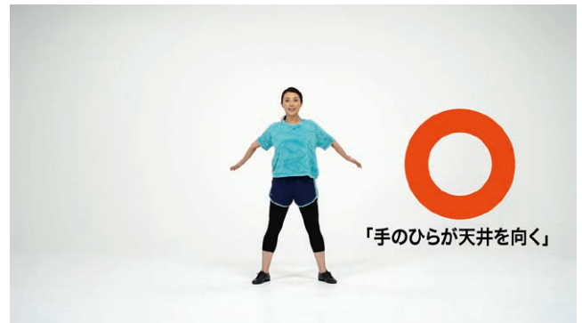
【動きの練習】 基本バージョンの一場面