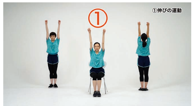
【通しの動画】 元気に動こう3人バージョンの一場面