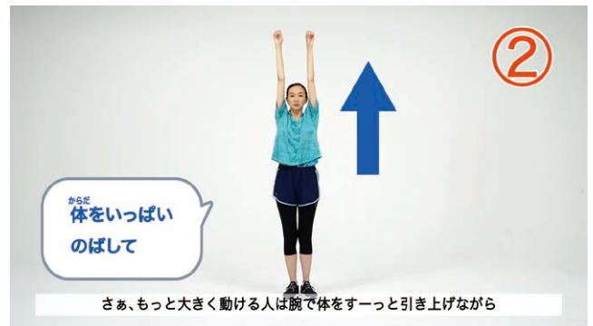
【動きの練習】 視覚情報の多いバージョンの一場面