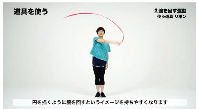
【付録】 道具を使って練習の一場面